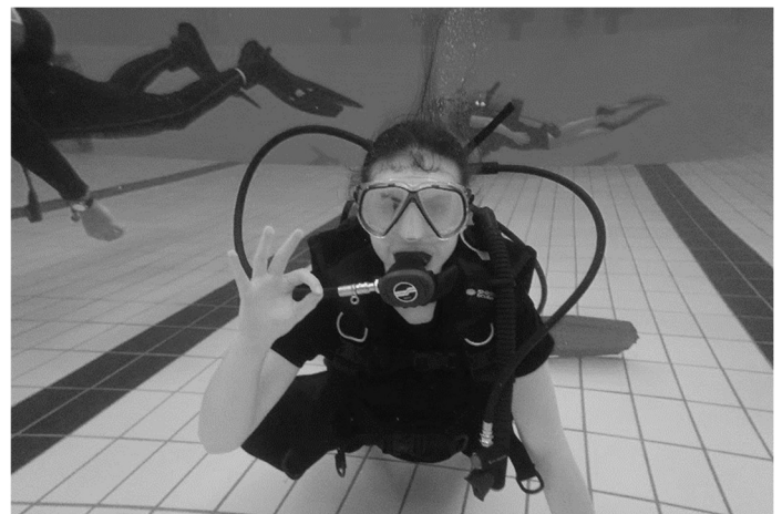
Photo d'une cadette de Caplan lors de l'activité de plongée de décembre.

Les activités des cadets s'adressent aux jeunes de 12 à 18 ans et ont lieu le vendredi soir de 18 h 30 à 21 h 30 à l'aréna de New Richmond.